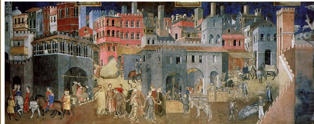
Fresque « Du bon gouvernement », de Lorenzetti (1338-1339) Sienne. Les effets de concorde et d'harmonie du gouvernement fondé sur la justice et les vertus.

UNIVERSITÉ DU HAVRE (UFR LSH) Amphi J. Durand 25 rue Philippe LEBON Le Havre 76600