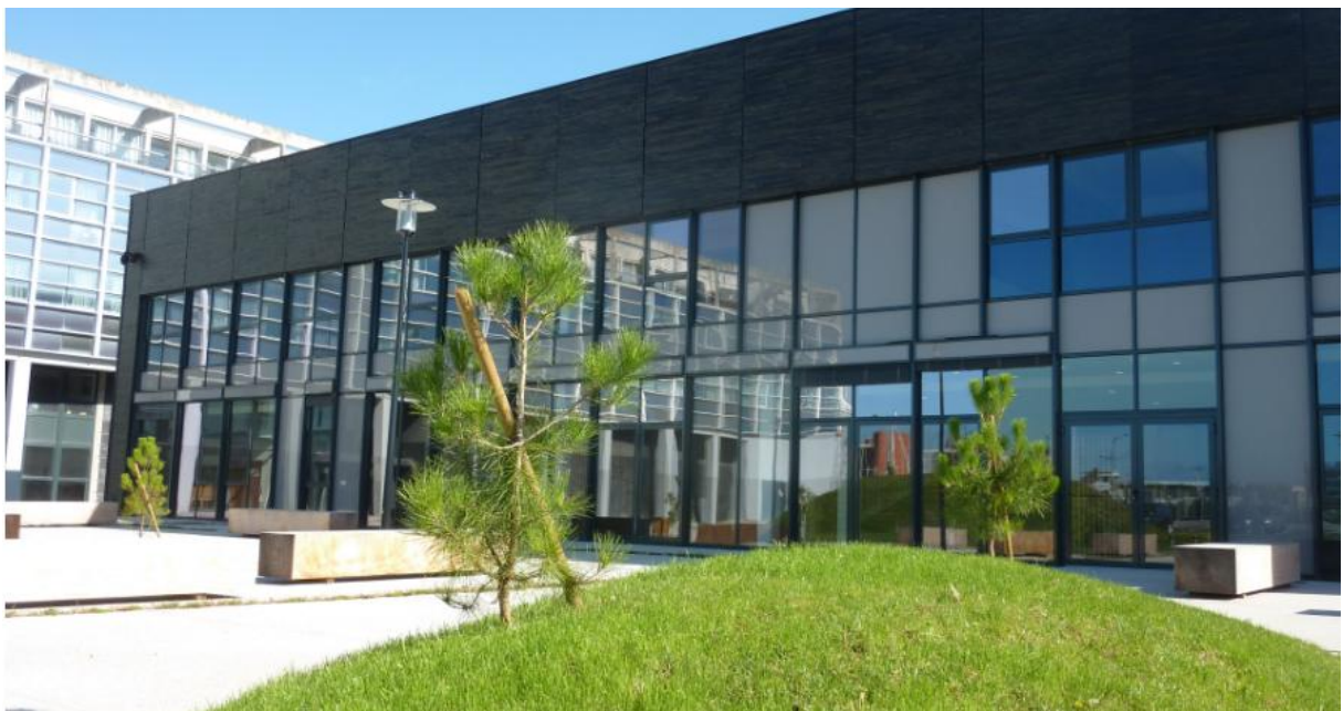
The PIL building