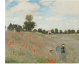
D Les Coquelicots Claude Monet Argenteuil