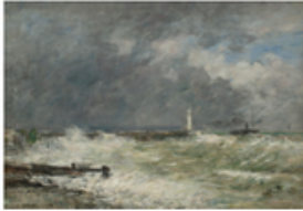
A Entrée des jetées du Havre par gros temps Eugène Boudin Le Havre