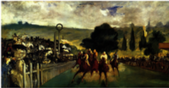
E Courses à Longchamp Edouard Manet Longchamp