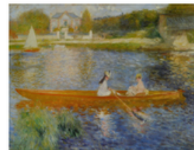
L La Yole Auguste Renoir Chatou