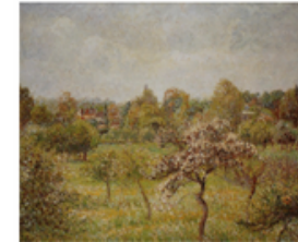
H Pommiers en fleurs Camille Pissarro Eragny