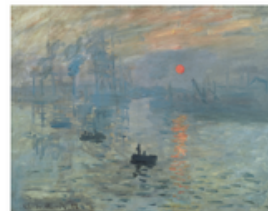
K Impression, soleil levant Claude Monet Le Havre