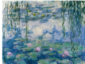
F Les Nymphéas Claude Monet Giverny