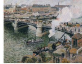
C Le Pont Boieldieu à Rouen, temps mouillé Camille Pissarro Rouen