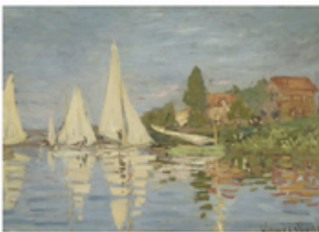
I Régates à Argenteuil Claude Monet Argenteuil