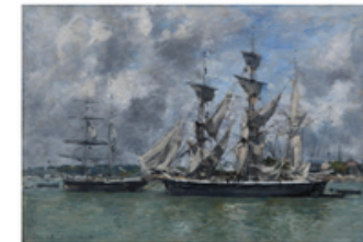
M Trois-mâts au port Eugène Boudin Honfleur