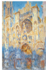
J La Cathédrale de Rouen Claude Monet Rouen