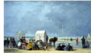
G L'heure du bain à Deauville Eugène Boudin Deauville