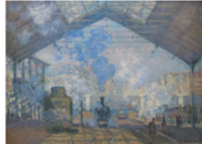
B La Gare Saint-Lazare Claude Monet Paris